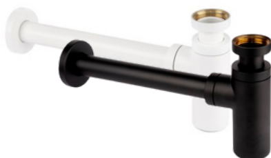
120 WHITE lub BLACK