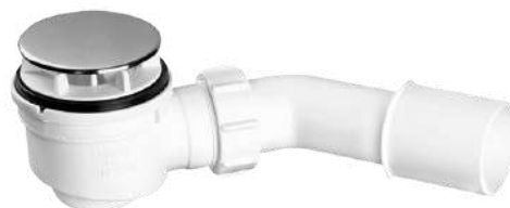
niski, wys. 65mm, do otworu 50mm HC252570B