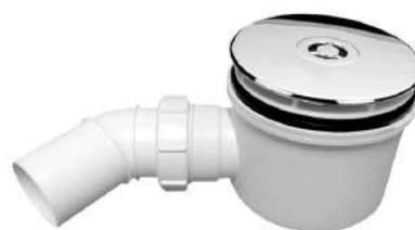
wysoki parametr przepustowości - 50l/min HC2750LCP