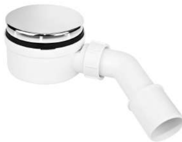
niski, wys. 60mm, do otworu 90mm HC2730LCPN-PB

chrom (CP) ● biały (WH) ● czarny (MB) ● stal szorstkowana (SN) ● mosiądz (AB) ● satyna (SC) ● złoty (gold/PVD) ●