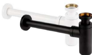
120 WHITE lub BLACK